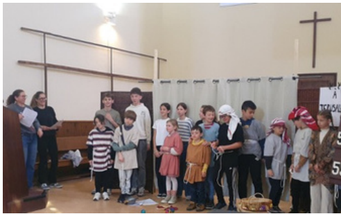
Fête des Rameaux, Journée d'offrande et de printemps