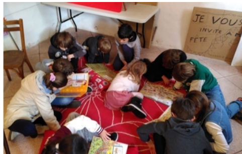
Séance d'école biblique