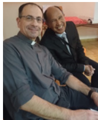
Semaine de l'unité des chrétiens