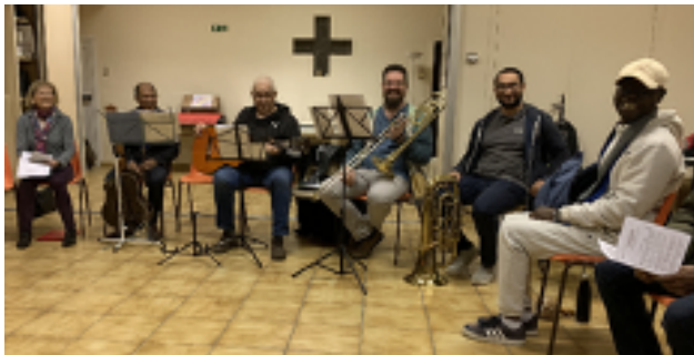
Réunion œcuménique à l'occasion de la Journée mondiale de prière