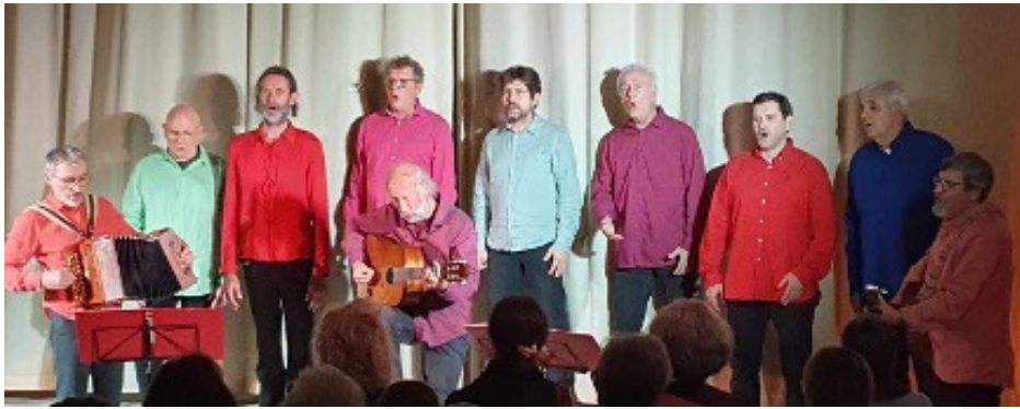
Concert N'Hommes le samedi 17 janvier au bénéfice de Welcome