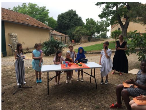
Les enfants et leur monitrice