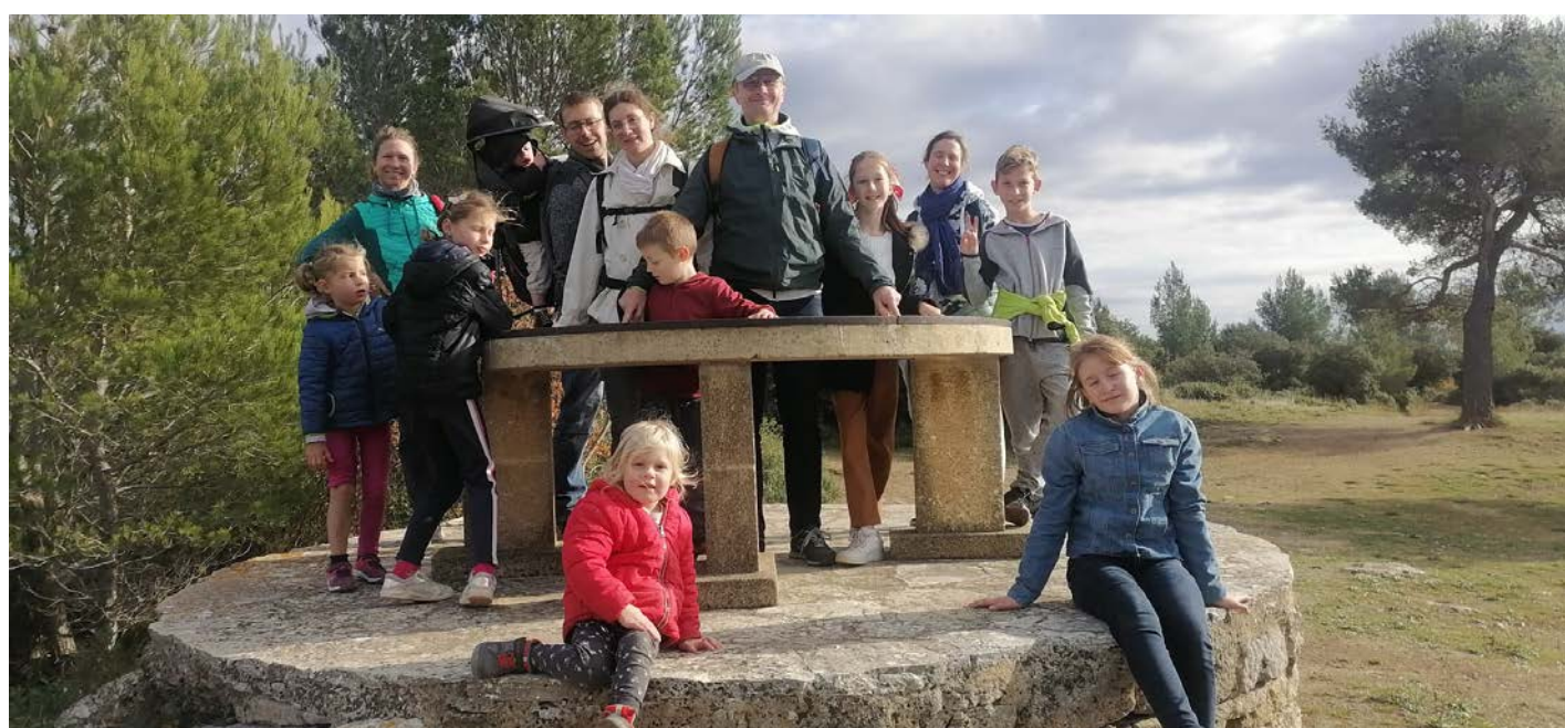
sortie jeunes familles dans le Talagard